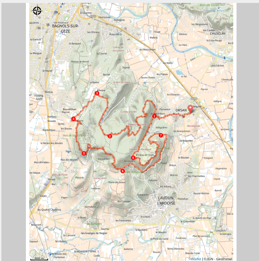
Forum et basilique du Camp de César