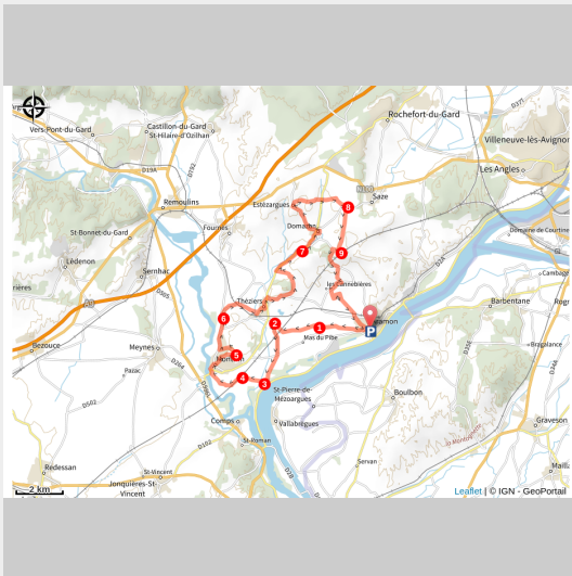
Confluence du Gardon et du Rhône