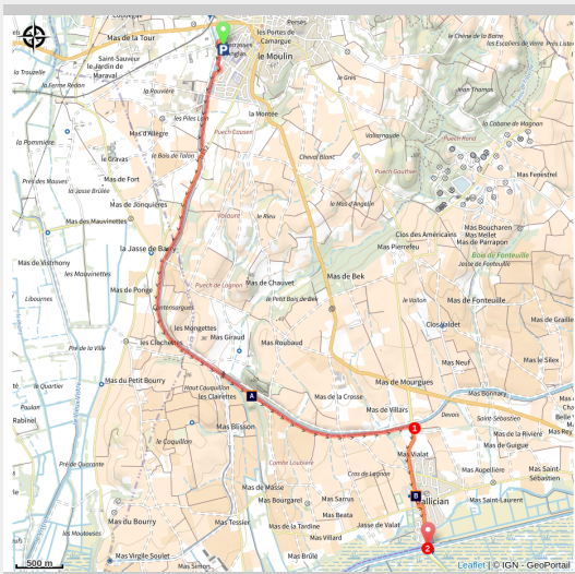
Voie verte de Vauvert