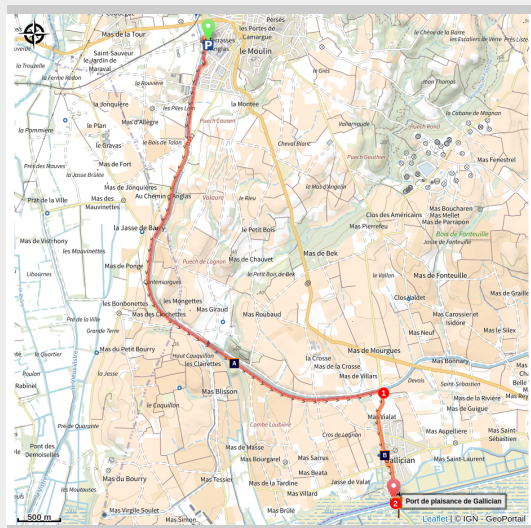
Voie verte de Vauvert

Cette voie verte Vauvert-Gallician, ouverte aux cyclistes, randonneurs, rollers et personnes à mobilité réduite, longe le canal Philippe Lamour, sur plus de 5 kilomètres.