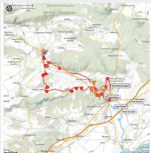
Le Duché d'Uzès