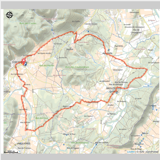
Piémont cévenol