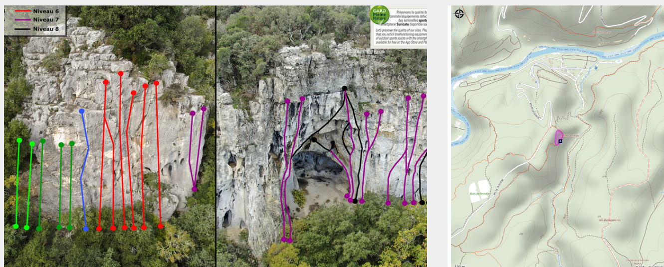
Voies du Roc de l'Aigle

Situé à Méjannes-le-Clap dans l'Espace Naturel Sensible Départemental du "Massif et Gorges de la Cèze", le site du Roc de l'Aigle permet de pratiquer l'escalade dans un cadre boisé des plus agréables.