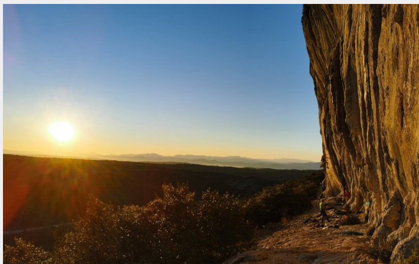
Escalade secteur Nouveau Monde (Mont Bouquet)